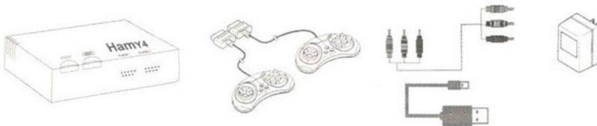
Комплектация приставки Hamu 4